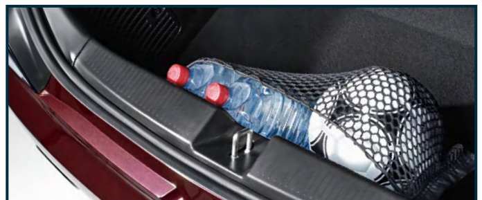
Pionowa siatka bagażowa