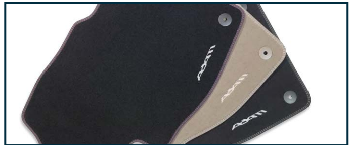
Welurowe dywaniki podłogowe