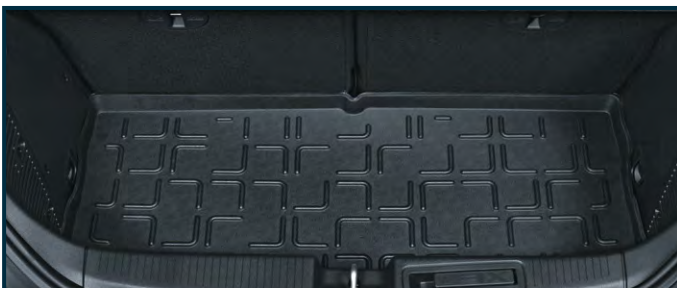
Mata podłogi bagażnika