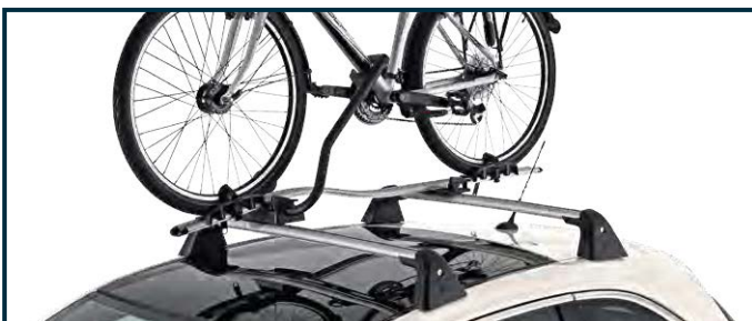
Uchwyt rowerowy Thule ProRide 591