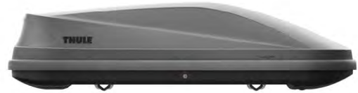
Pojemnik dachowy Thule Touring 200