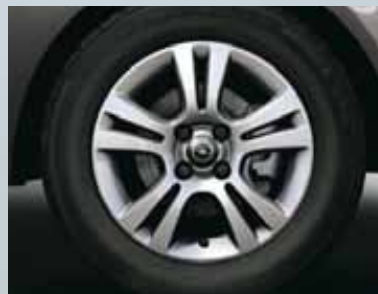
Felgi aluminiowe 15 x 6", 5-ramienne (podwójne), opony 185/65 R 15