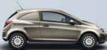
Złoto-beżowy Pepper Dust