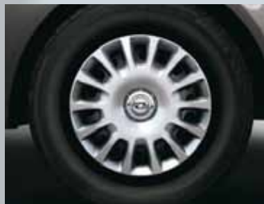
Felgi stalowe z kołpakami 14 x 5,5", 14-ramienne, opony 185/70 R 14