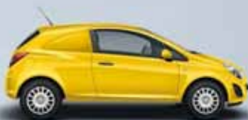
Żółty Sunny Melon