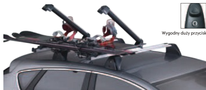
Wygodny duży przycisk

Wysuwana podstawa Wysuwana poza obrys auta jednym ruchem ręki podstawa uchwytu, umożliwiająca załadunek lub zdjęcie nart bez konieczności sięgania na dach auta.