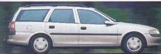
Kombi: wymiary 4490/1707/1445 mm, rozstaw osi 2637 mm, rozstaw kół p/t 1464/1463 mm