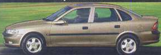
Limuzyna 4-drzwiowa: wymiary 4495/1707/1420 mm, rozstaw osi 2637 mm, rozstaw kół p/t 1464/1463 mm