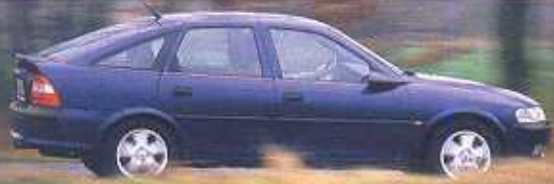
Limuzyna 5-drzwiowa: wymiary 4495/1707/1420 mm, rozstaw osi 2637 mm, rozstaw kół p/t 1464/1463 mm