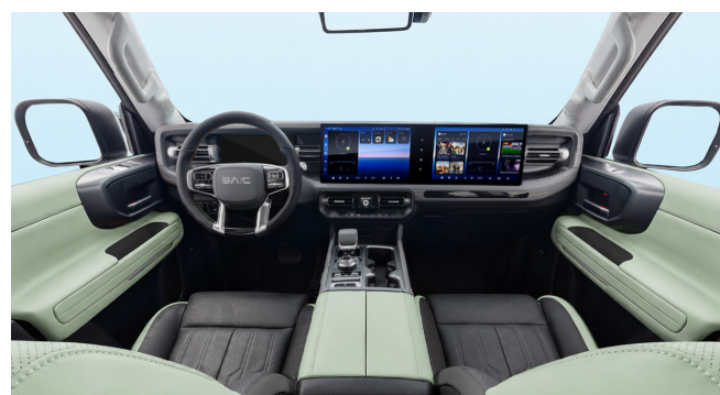
Ciemnoszara/czarna tonacja wnętrza z pastelowymi, zielonymi wstawkami na fotelach, obiciach drzwi i środkowym podłokietniku.