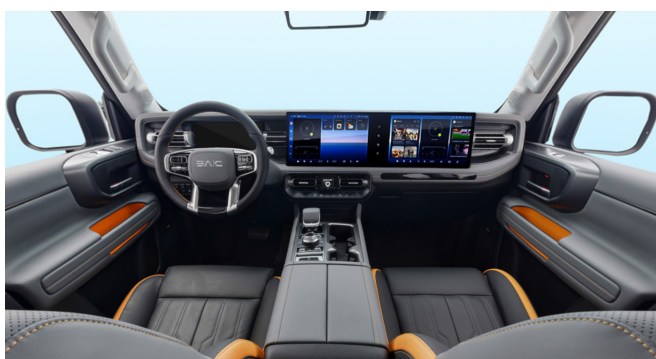
Ciemnoszara tonacja wnętrza z pomarańczowymi wstawkami na fotelach i obiciach drzwi.