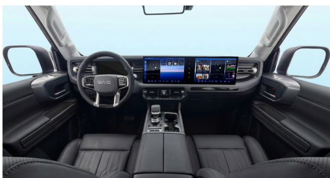
Czarna tonacja wnętrza