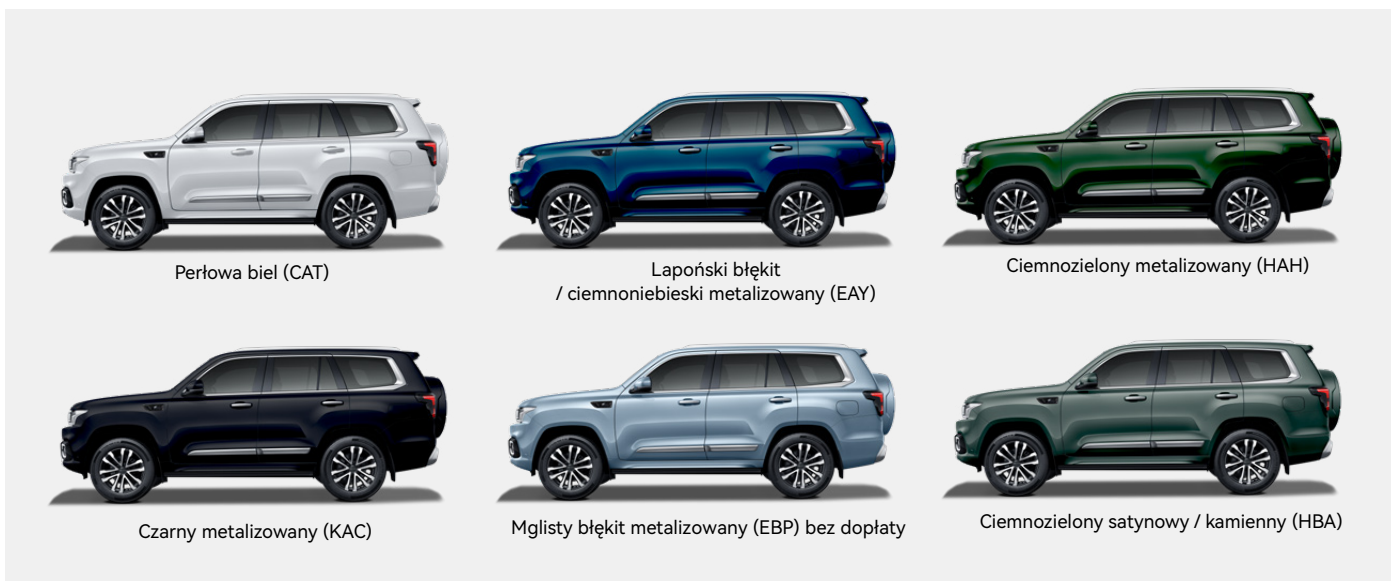
Perłowa biel (CAT)