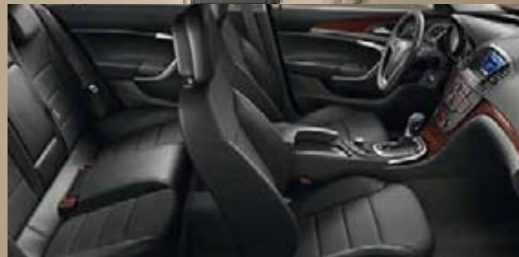
Avenue/Morrocana, czarny Listwy ozdobne: Piano Black, Kibo Wood

1 Skóra naturalna łączona ze skórą sztuczną.