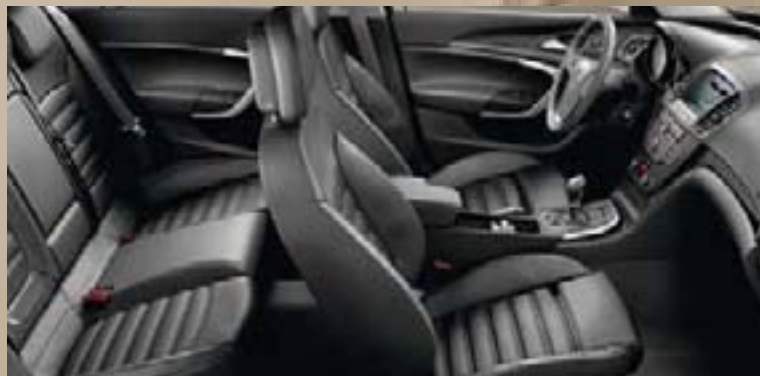
Tapicerka skórzana 1 Siena, czarny (perforowany) Listwy ozdobne: Rapid Cool, Piano Black, Kibo Wood

1 Skóra naturalna łączona ze skórą sztuczną.