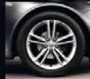
5 Obręcze ze stopów lekkich, 8J x 18, 5 podwójnych ramion, opony 245/45 R 18 (Q02).