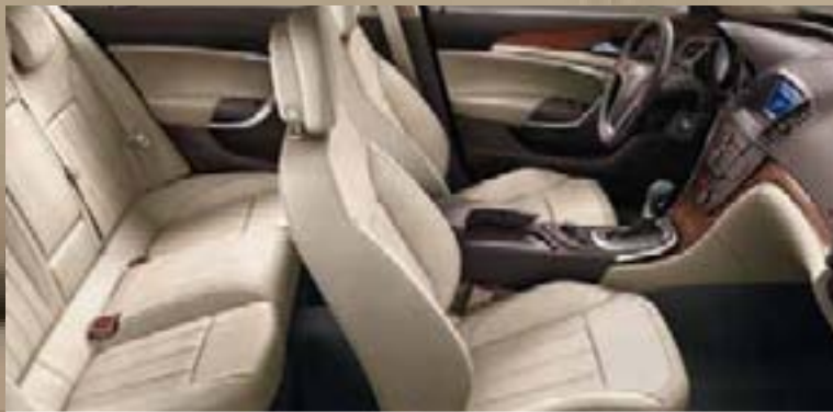
Tapicerka skórzana 1 Siena, beżowy Listwy ozdobne: Rapid Warm, Kibo Wood