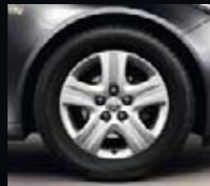
3 Obręcze strukturalne, 7J x 17, 5 ramion, opony 225/55 R 17 (QR8).