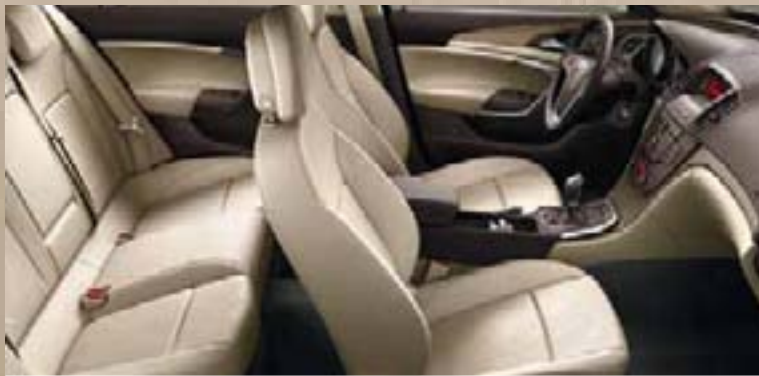
Dune/Atlantis, beżowy Listwa ozdobna: Rapid Warm