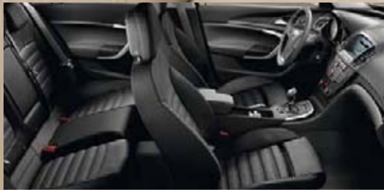
Vitesse/Atlantis, czarny Listwy ozdobne: Rapid Cool, Piano Black