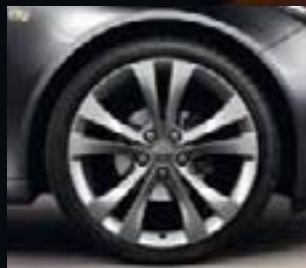
10 Obręcze ze stopów lekkich, 8,5 J x 20, 5 podwójnych ramion, opony 245/35 R 20 (Q9U), z wielowarstwową powłoką lakierniczą.