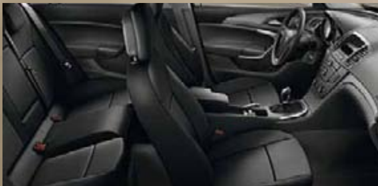
Labyrinth/Atlantis, czarny Listwa ozdobna: Rapid Cool