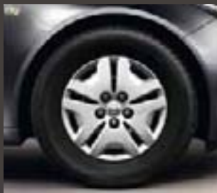
1 Obręcze stalowe z kołpakami, 6,5J x 16 o wzorze 5-ramiennym, opony 215/60 R 16 (QB5).

4 Nie dotyczy wersji z silnikami 1,6 litra ECOTEC® i 2,0 litra CDTI ECOTEC® (110 km).