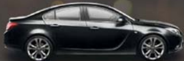
Czarny Carbon Flash