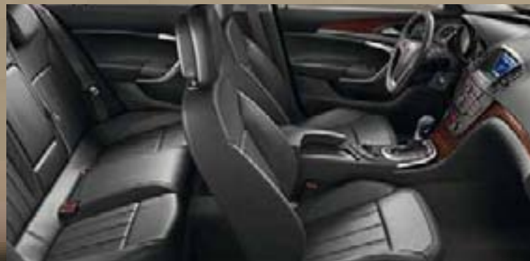
Tapicerka skórzana 1 Siena, czarny Listwy ozdobne: Rapid Cool, Piano Black, Kibo Wood