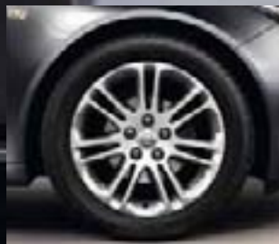
7 Obręcze ze stopów lekkich, 8 J x 18, 7 podwójnych ramion, opony 245/45 R 18 (Q60).