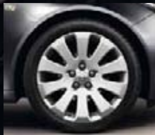
9 Obręcze ze stopów lekkich, 8,5 J x 19, 10 ramion, opony 245/40 R 19 (Q9S), z jasnym wykończeniem.