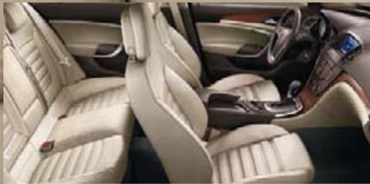
Tapicerka skórzana 2 Siena, beżowy (perforowany) Listwy ozdobne: Rapid Warm, Kibo Wood