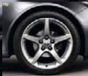
8 Obręcze ze stopów lekkich, 8,5 J x 19, 5 ramion, opony 245/40 R 19 (Q93), z wielowarstwową powłoką lakierniczą.