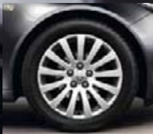
6 Obręcze ze stopów lekkich, 8 J x 18, 13 ramion, opony 245/45 R 18 (Q56).