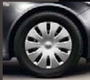
2 Obręcze stalowe z kołpakami, 7J x 17 o wzorze 10-ramiennym, opony 225/55 R 17 (QR4).