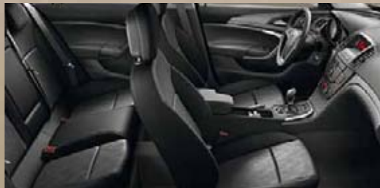
Dune/Atlantis, czarny Listwa ozdobna: Rapid Cool