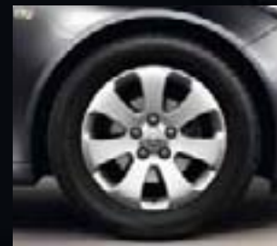
4 Obręcz ze stopów lekkich, 7J x 17, 7 ramion, opony 225/55 R 17 (Q00).