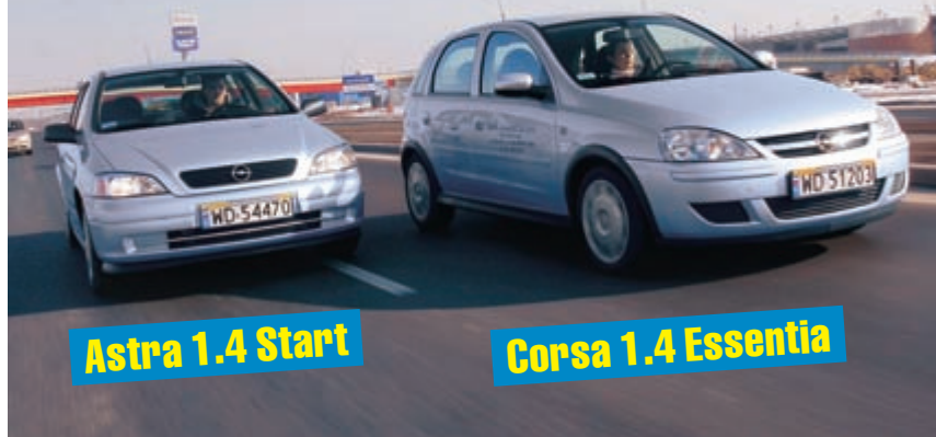
Astra 1.4 Start