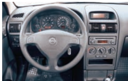
Astra: wyposażenie ubogie, a materiały słabej jakości. Radio z CD kosztuje aż 1850 zł

montowano je z mniejszego pojazdu w nieco większej specyfikacji. Mają za małe zagłówki niedające należytej możliwości regulacji, słabo trzymają na zakrętach. Chociaż Astra jest niewielkim kompaktem i daje pasażerom mizerne poczucie przestrzeni, to ilość miejsca na nogi nie wzbudza zastrzeżeń i wystarczy nawet wysokim kierowcom. Bagażnik okazuje się znacznie większy niż w Corsie. Tworzywa nie zachwycają jakością do momentu, gdy nie wsiądziemy do mniejszego z Opli. Corsa ma w środku modniejsze linie, jednak plastiki są miejscami twarde jak skała. Z drugiej strony, gdy ktoś nie jest zadowolony z wykończenia i nie jeździ z całą rodziną, Corsa w zupełności mu wystarczy.