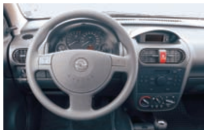
Corsa: seryjne radio z CD. Komputer pokładowy i klimatyzacja manualna za dopłatą

Przewaga przestronności i pojemności bagażnika jest dla Corsy druzgocąca. Zarówno z przodu, jak i z tyłu w Astrze jest znacznie więcej miejsca, mimo że mniejszy Opel należy do najprzystronniejszych samochodów swojego segmentu. Jedyna poważna wada kokpitu Astry to, delikatnie mówiąc, niezbyt wyszukane fotele, które wyglądają jakby wy-