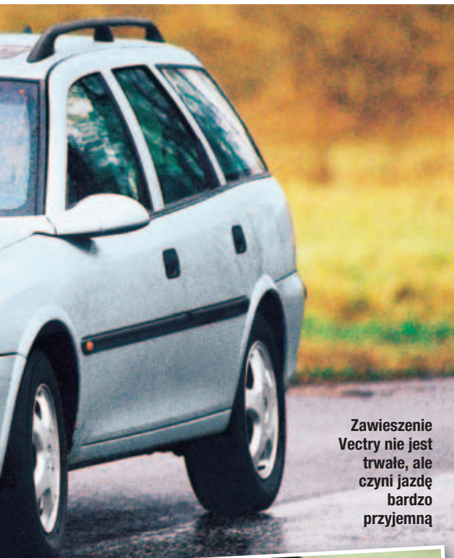
Zawieszenie Vectry nie jest trwałe, ale czyni jazdę bardzo przyjemną