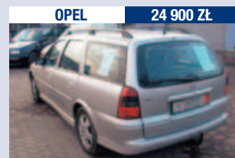
OPEL 24 900 Zł

Vectra 1.7 TD/82 KM, 1996 r., 115 tys. km. ABS, hak, el. sterowane szyby i lusterka, wspomaganie kierownicy, immobiliser, sprowadzony.