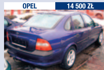
OPEL 14 500 Zł

Vectra 1.7 TD/82 KM, 1996 r., 115 tys. km. ABS, hak, el. sterowane szyby i lusterka, wspomaganie kierownicy, immobiliser, sprowadzony.