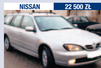
NISSAN 22 500 Zł

Laguna 1.9 DTI/115 KM, 1999 r., 140 tys. km, el. sterowane szyby i lusterka, Klimatronic, centralny zamek, welurowa tapicerka.