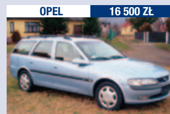
OPEL 16 500 Zł

Vectra 2.2 DTI/125 KM, 2000 r., 156 tys. km, pierwszy właściciel, auto z salonu, pełna opcja. W rozliczeniu możliwa zamiana.