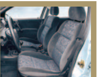
Często występujące trzeszczenie plastików ustępuje po ogrzaniu wnętrza