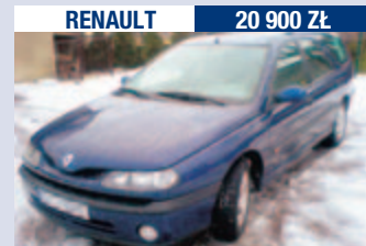
RENAULT 20 900 Zł

Vectra 2.0 DTI/101 KM, 2002 r., 190 tys. km, import z Włoch, el. sterowane szyby, klimatyzacja, ABS, autoalarm, welur.