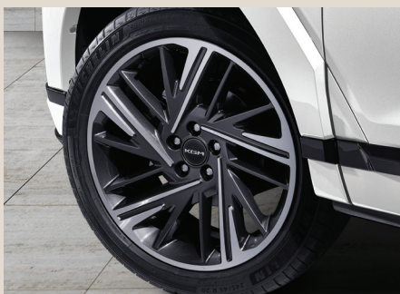
흡음형 미쉐린 타이어 & 20인치 다이아몬드 커팅 휠