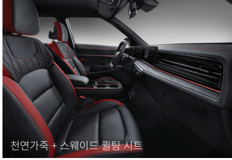
블랙/레드 투톤 인테리어