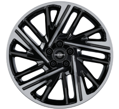
20인치 다이아몬드 커팅 휠 [타이어 : 245/45R20]