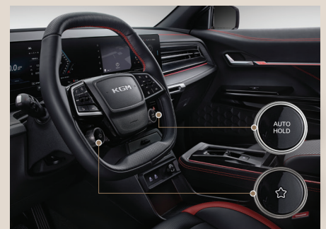
스티어링 휠 버튼 (즐거찾기, 오토홀드)