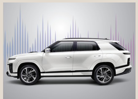
액티브 배기 사운드