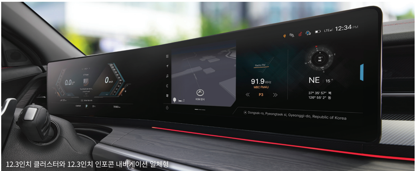
12.3인치 클러스터와 12.3인치 인포콘 내비게이션 일체형