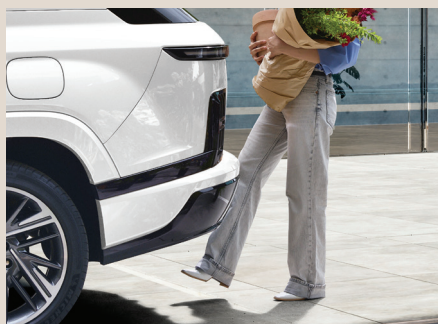
스마트 파워 테일게이트 (킥 모션 센서 포함)