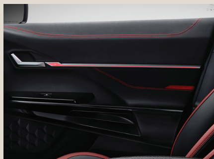
스웨이드 도어 트림